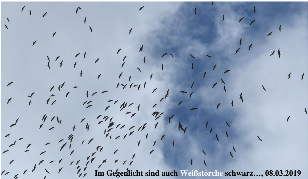
Im Gegenlicht sind auch Weißstörche schwarz..., 08.03.2019

Wir begannen den Tag mit einem Spaziergang zum Beobachtungspunkt von Playa de los Lances. Nachdem wir uns an einer wegversperrenden Kuhherde „vorbeigekämpft“ hatten, konnten wir erst viele Singvögel entdecken, darunter auch Iberischafstelzen. Am Strand rasteten dann kleine Trupps von Alpenstrandläufern, Sanderlingen, See- und Kiebitzregenpfeifern, und verbreiteten ein bisschen Nordseestimmung. Eine Raubseeschwalbe sah aus, als wachte sie wie eine Kindergärtnerin über einer Gruppe Limikolen. Zurück am Auto zog ein Schwarm von 243 Weißstörchen (ausgezählt) über uns.