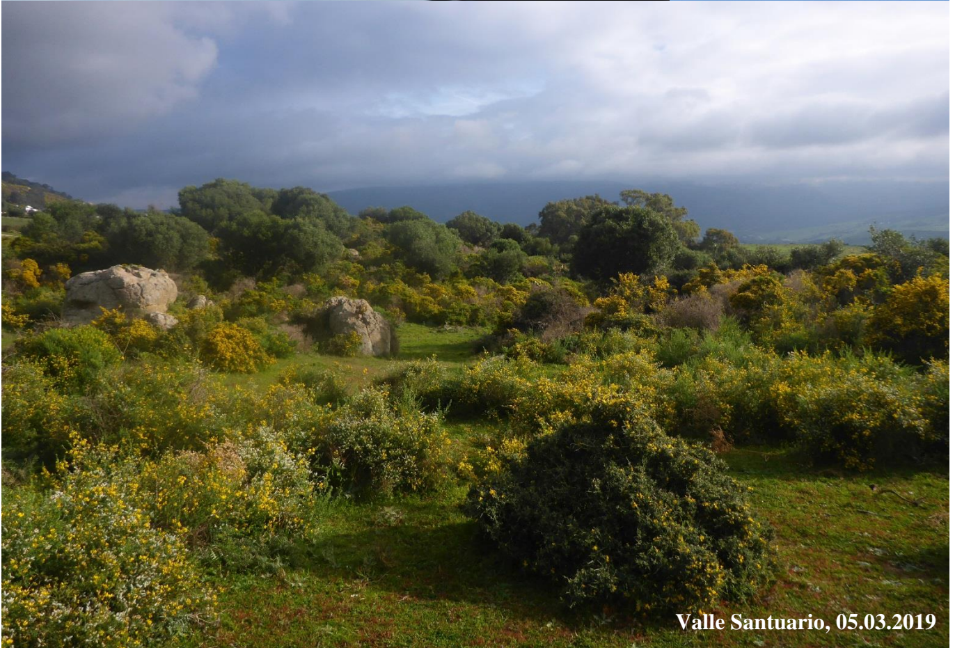
Valle Santuario, 05.03.2019