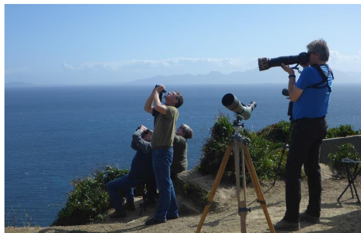
Punta Carnero, 07.03.2019