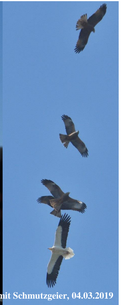
Schwarzmilane mit Schmutzgeier, 04.03.2019